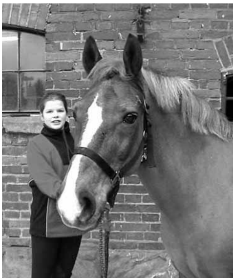
Vereinspony – Rudi