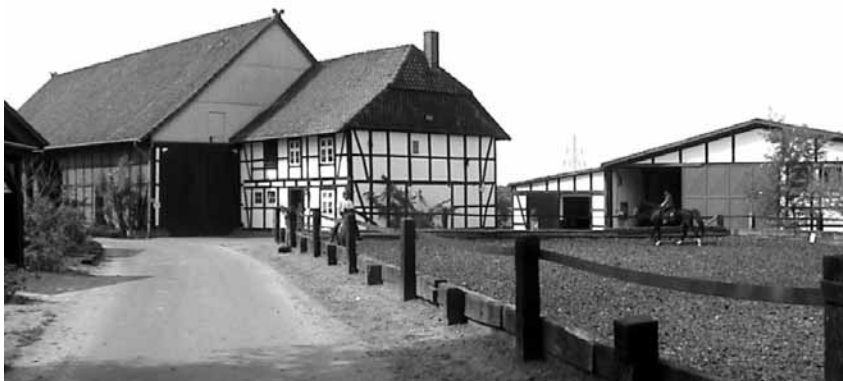
Hofeinfahrt mit Blick auf die Villa Bodenburg und Reithalle

Die Anlage von Reitplätzen und der Bau einer Reithalle hat den Pony- und Reit- Club Volkmarode von Anfang an beschäftigt, fand doch der Reitunterricht zunächst nur auf wechselnden Flächen statt, 1974/75 z.B. auf einem Gelände in Schapen, das heute längst bebaut ist. Schon Ende 1973 lag daher die erste Kalkulation für den Bau ei-