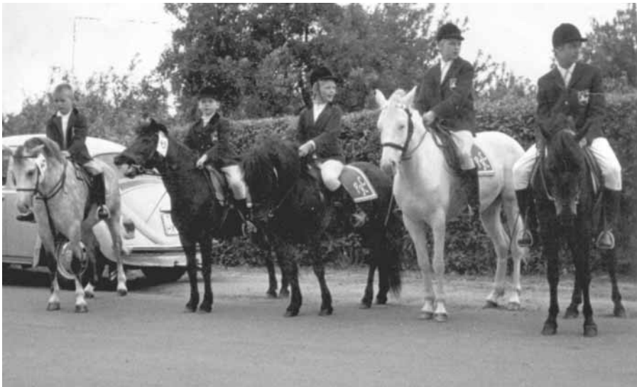
Der traditionelle Ausritt am 1. Mai 1972