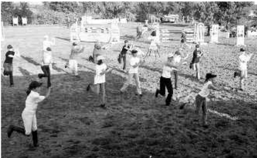
Showeinlage von "Anja and the Kids"

dar, zumal die EDV erst ab Mitte der 80er Jahre allmählich für etwas Entlastung sorgte. Heute scheint unvorstellbar, dass die Starterlisten ursprünglich alle mit drei Durchschlägen mit der Hand geschrieben werden mussten. Mit immer leistungsfähiger werdender EDV und jungen Kräften, die in der Lage waren, die umfangreichen Möglichkeiten auch zu nutzen, waren später Turniere mit 500 und mehr Pferden (1998: 759 genannte Pferde!) ebenfalls noch durchführbar, wenn auch nicht zu verkennen ist, dass der Verein dabei dennoch allmählich an seine Leistungsgrenze stösst. Auch die Einbindung von Fahrprüfungen für Ponies, von 1977 bis 1989 regelmäßiger Bestandteil unserer Ausschreibungen, war schwierig zu organisieren. Mit Starterfeldern von maximal 10 bis 15 Gespannen standen sie leider immer im Schatten der großen Starterfelder der Reiterinnen und Reiter. Ein letzter Versuch, sie im Mai 1995 wieder in das Programm aufzunehmen, schlug wegen zu geringer Anzahl der Nennungen fehl. Fahrturniere müssten eher eigenständige Veranstaltungen werden wie der Fahrertag am 28.