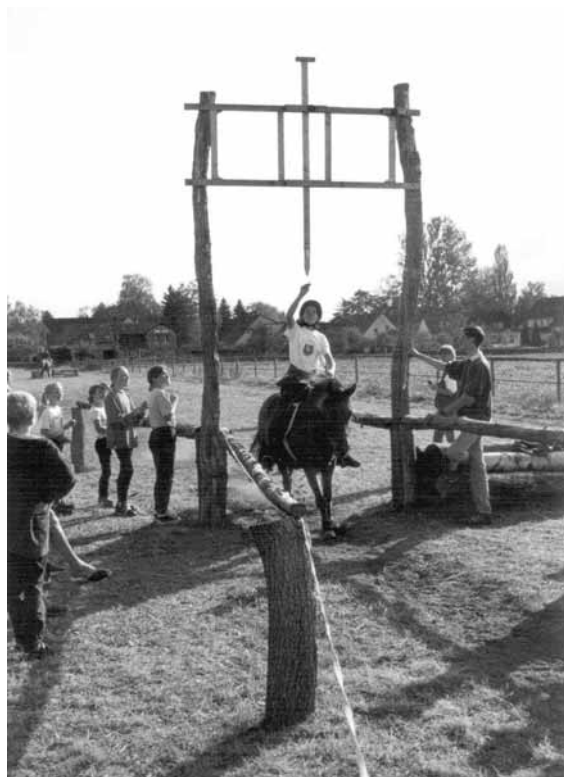
Fahnenjagen veranstaltet von den Freizeitreitern