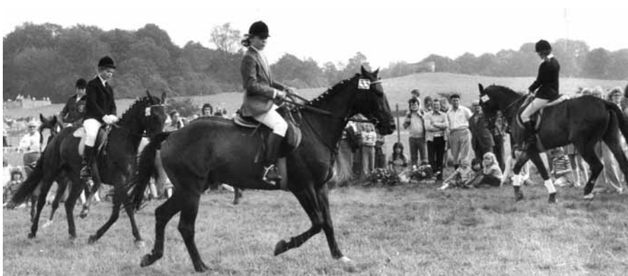
Reitturnier am 16.9.74 auf dem Franzschen Feld.