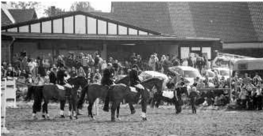
Preisverleihung während des Septemberturniers im Jahr 2000