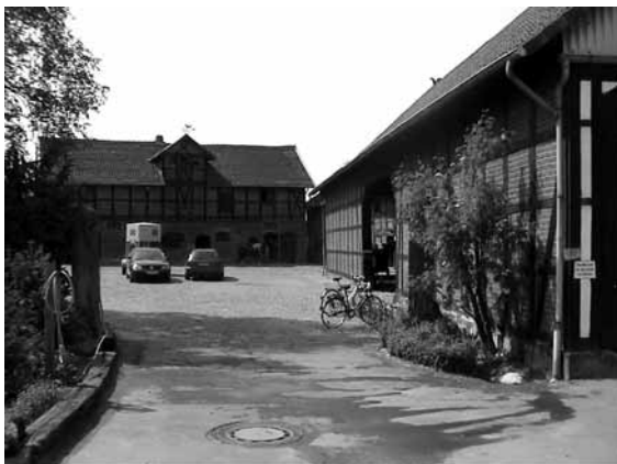
Der Hof mit Scheune und Stallungen

Die Durchführung auch schon kleinerer Veranstaltungen in Volkmarode, vor allem dann, wenn auch Gäste zu erwarten waren, machte den Bau von Toiletten dringend erforderlich. Die Familie Fischer stellte die Räume dafür zur Verfügung und der Pony- und Reit- Club Volkmarode erstellte im Jahre 1983 gemeinsam mit dem Kleintierzuchtverein Volkmarode, der bei Familie Fischer ebenfalls